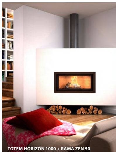
TOTEM HORIZON 1000 + RAMA ZEN 50