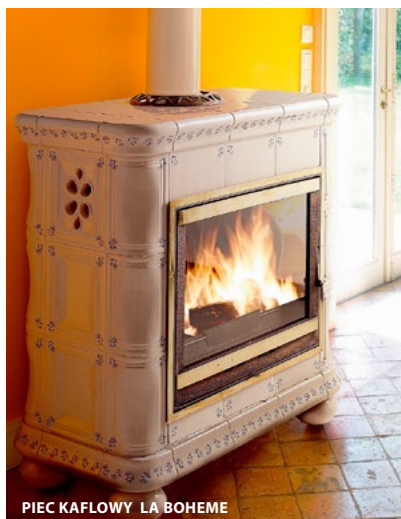
PIEC KAFLOWY LA BOHEME