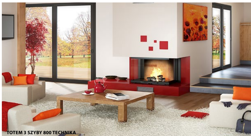
TOTEM 3 SZYBY 800 TECHNIKA